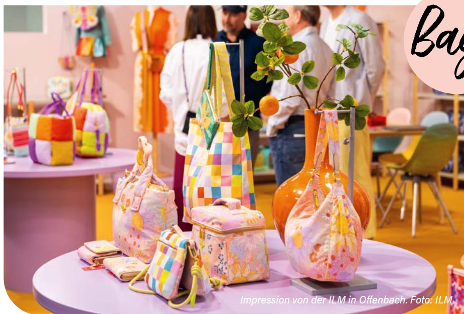
Impression von der ILM in Offenbach.

Der stationäre Lederwarenhandel, der in den Jahren 2020 und 2021 stark unter den Folgen der Corona-Pandemie gelitten hatte, konnte seine Aufholjagd im ersten Halbjahr 2023 weiter fortsetzen. Nach Schätzungen des Handelsverbands Textil (BTE) liegen die Umsätze der Lederwarengeschäfte in den ersten sechs Monaten im Durchschnitt rund fünf Prozent über den Werten von 2022. Viele Unternehmen haben damit aktuell wieder das Vor-Corona-Niveau erreicht und zum Teil sogar leicht übertroffen.