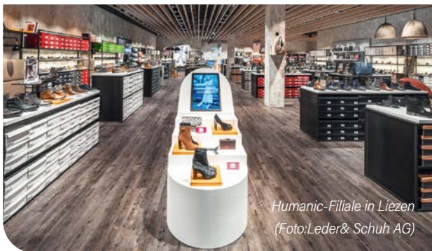
Humanic-Filiale in Liezen