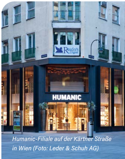
Humanic-Filiale auf der Kärtner Straße in Wien