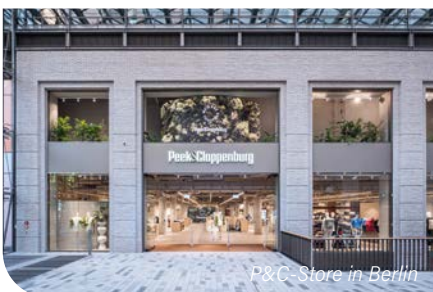
P&C-Store in Berlin

Die Gläubiger des Düsseldorfer Modehändlers Peek & Cloppenburg KG haben den beim zuständigen Amtsgericht in Düsseldorf vorgelegten Insolvenzplan mit großer Mehrheit angenommen. Die Aufhebung des Insolvenzverfahrens in Eigenverwaltung wäre damit bis zum Herbst möglich. Im Insolvenzplan wurde eine weitgehende Beschäftigungssicherung und Standortgarantie festgelegt. Zudem hat die Hauptgesellschafterin umfangreiche Investitionszusagen gegeben. Die Gläubiger müssen wohl auf den Großteil ihrer Forderungen verzichten. Deren Forderungen belaufen sich auf 380 Millionen Euro. Laut Medienberichten sollen sie nun 50 Millionen Euro erhalten. Betroffen sind vor allem die kreditgebenden Banken. Das Traditionsunternehmen hatte im März angesichts tieferer Zahlen Rettung in einem Schutzschirmverfahren gesucht.