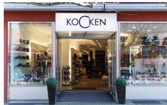
Schuhhaus Kocken in Viersen