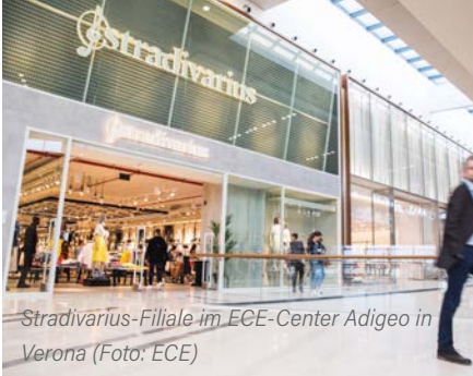
Stradivarius-Filiale im ECE-Center Adigeo in Verona