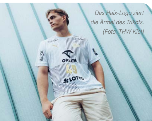
Das Haix-Logo ziert die Ärmel des Trikots.

Das süddeutsche Funktionsschuhhersteller Haix engagiert sich ab sofort als Teamsponsor für den viermaligen Handball-Champions-League-Sieger THW Kiel. Künftig wird das Haix-Logo das Warm-up-Shirt und den Ärmel des Champions-League-Trikots der Kieler Handballer zieren. Neben dem Trikotärmel wird Haix auch mit einem Spot auf der LED-Bande sowie mit einem Bodenaufkleber auf dem Hallenboden präsent sein. Darüber hinaus sind mit dem neuen Teamsponsor des THW Kiel unter anderem Vor-Ort-Aktionen und digitale Einbindungen geplant. Haix ist ein 1948 gegründetes Unternehmen mit Sitz im bayrischen Mainburg. Die Firma stellt Funktionsschuhe und -bekleidung her, die international von 2.300 Mitarbeitern entwickelt, produziert, vermarktet und vertrieben werden. Die Herstellung findet ausschließlich in den europäischen Ländern Deutschland, Kroatien und Serbien statt.