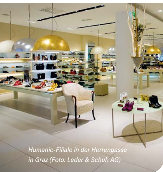
Humanic-Filiale in der Herrengasse in Graz