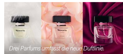
Drei Parfüms umfasst die neue Duftlinie.