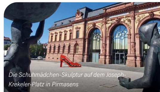
Die Schuhmädchen-Skulptur auf dem Joseph-Krekeler-Platz in Pirmasens