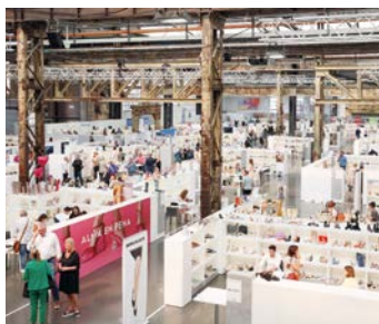
Impression von der Shoes Düsseldorf