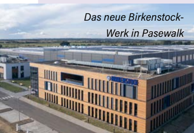
Das neue Birkenstock-Werk in Pasewalk

Nach einer Bauzeit von rund 17 Monaten hat die neue Fertigungsstätte von Birkenstock im Industriepark Berlin-Szczecin bei Pasewalk ihren Betrieb aufgenommen. Mit einem Volumen von knapp 110 Millionen Euro ist es die größte Einzelinvestition in der Geschichte des Unternehmens. Zunächst startet das Werk mit etwa 200 Mitarbeitern, die sowohl im Produktions- als auch im administrativen Bereich arbeiten. Anschließend werden die Kapazitäten in Pasewalk im Rahmen eines sogenannten Ramp-Up-Prozesses schrittweise erweitert bis zu einer Ausbaustufe mit mittelfristig etwa 1.000 Beschäftigten. Bis zu 6,4 Millionen Paar Schuhe pro Jahr sollen in der neuen Fabrik einmal hergestellt werden. Parallel wird das Werk in Görlitz refokussiert und komplett auf Kork-Latex-Produktion umgestellt.