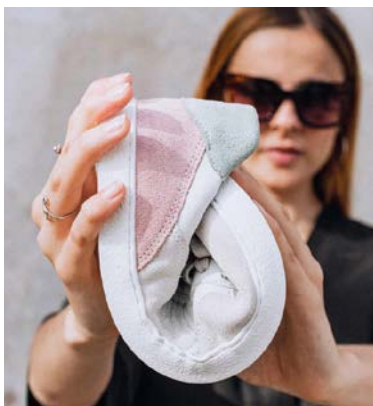
Dünne und flexible Sohle: Groundies-Barfußschuhe sind jetzt bei Weltbild erhältlich.

Die ersten Modelle von Groundies, der Barfußschuhmarke aus Freiburg, sind ab sofort im Weltbild-Onlineshop erhältlich. Groundies war im Juli dieses Jahres von der Holding Weltbild D2C Group übernommen worden. Damit werden die Schuhe einem breiteren Publikum zugänglich. Die Weltbild-Gruppe zählt über neun Millionen aktive Kunden. Das Startangebot umfasst Modelle für Damen, Unisex-Modelle und Kinderschuhe. Der Start von Groundies bei Weltbild wird mit einer Online-Kampagne unterstützt, zum Beispiel mit Newslettern, Sonderpunkten via DeutschlandCard, einer Social Media-Kampagne, redaktionellem Content rund um Barfußschuhe und einem Gewinnspiel. Im aktuellen Katalog wird die neue Marke ebenfalls beworben.